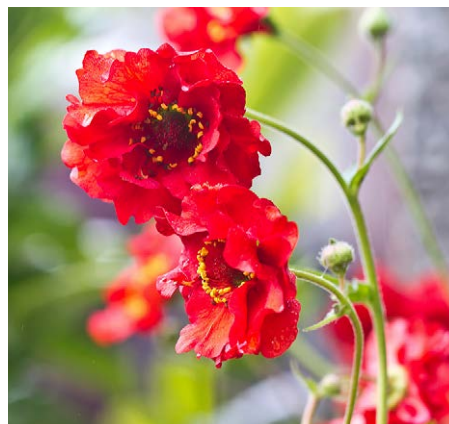
Geum chilense 'Mrs Bradshaw'