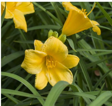
Hemerocallis 'Stella d'Oro'