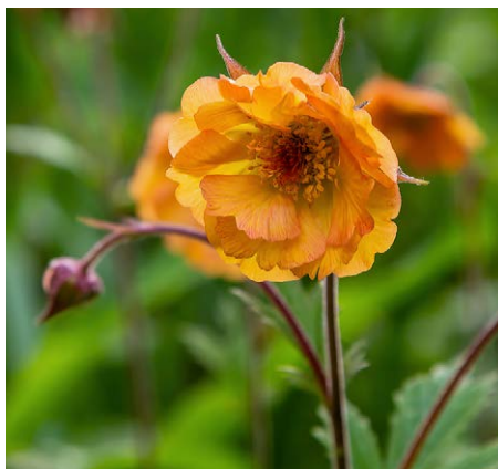
Geum 'Totally Tangerine'