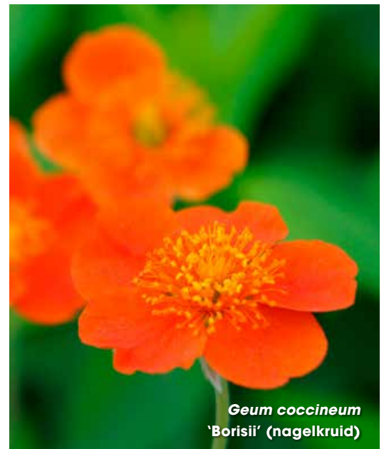
Geum coccineum 'Borisii' (nagelkruid)