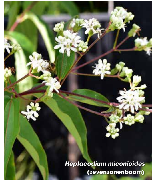
Heptacodium miconioides (zevenzonenboom)

'Royal Burgundy' is één van de drie meerstammige boompjes in deze tuin.