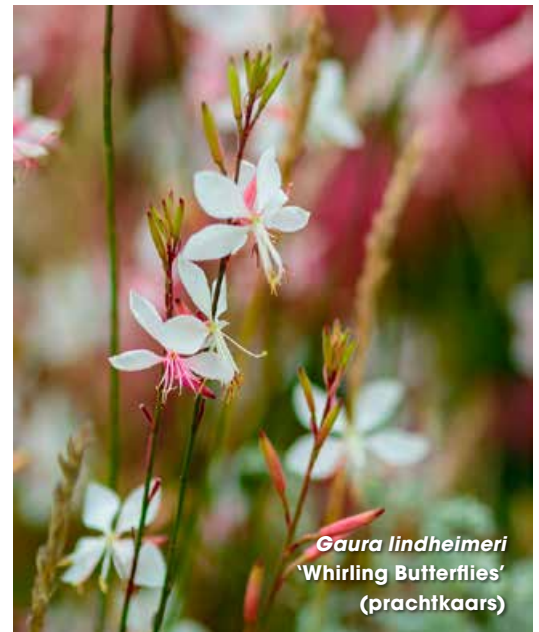
Gaura lindheimeri 'Whirling Butterflies' (prachtkaars)